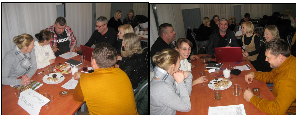
Grupa Odnowy Wsi w czasie warsztatów opracowania Sołeckiej Strategii Rozwoju Świetlica wiejska w Zapuście w dniach 04-05.12.2023 r.

SOLECKA STRATEGIA ROZWOJU – KLUCZEWO wypracowana przez GOW na warsztatach w ramach programu UMWW - „Wielkopolska Odnowa Wsi 2020+”