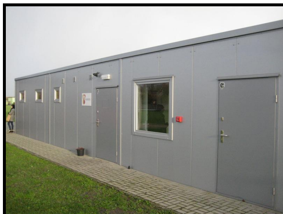
Pomieszczenie pełniące funkcję świetlicy wiejskiej