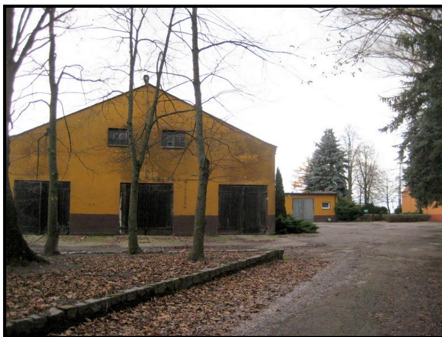
Zabudowania po byłej Rolniczej Spółdzielni Produkcyjnej

ZASOBY – wszelkie elementy materialne i niematerialne wsi i związanego z nią obszaru, które mogą być wykorzystane obecne ładź w przyszłości w realizacji publicznych ładź prywatnych przedsięwzięć odnowy wsi. Zwrócić uwagę na elementy specyficzne i rzadkie (wyróżniające wieś). Opracowanie: Ryszard Wilczyński