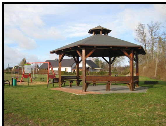
Miejsce spotkań i rekreacji