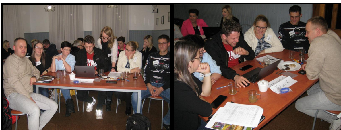
Grupa Odnowy Wsi w czasie warsztatów opracowania Sołeckiej Strategii Rozwoju Świetlica wiejska w Zapuście w dniach 04-05.12.2023 r.

SOLECKA STRATEGIA ROZWOJU – WIELONEK wypracowana przez GOW na warsztatach w ramach programu UMWW - „Wielkopolska Odnowa Wsi 2020+”