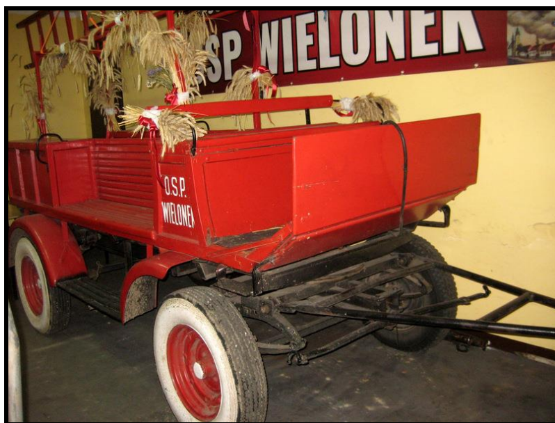
Zabytkowy wóz strażacki

SOLECKA STRATEGIA ROZWOJU – WIELONEK wypracowana przez GOW na warsztatach w ramach programu UMWW - „Wielkopolska Odnowa Wsi 2020+”