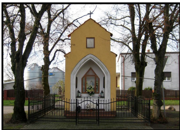
Miejsce kultu religijnego