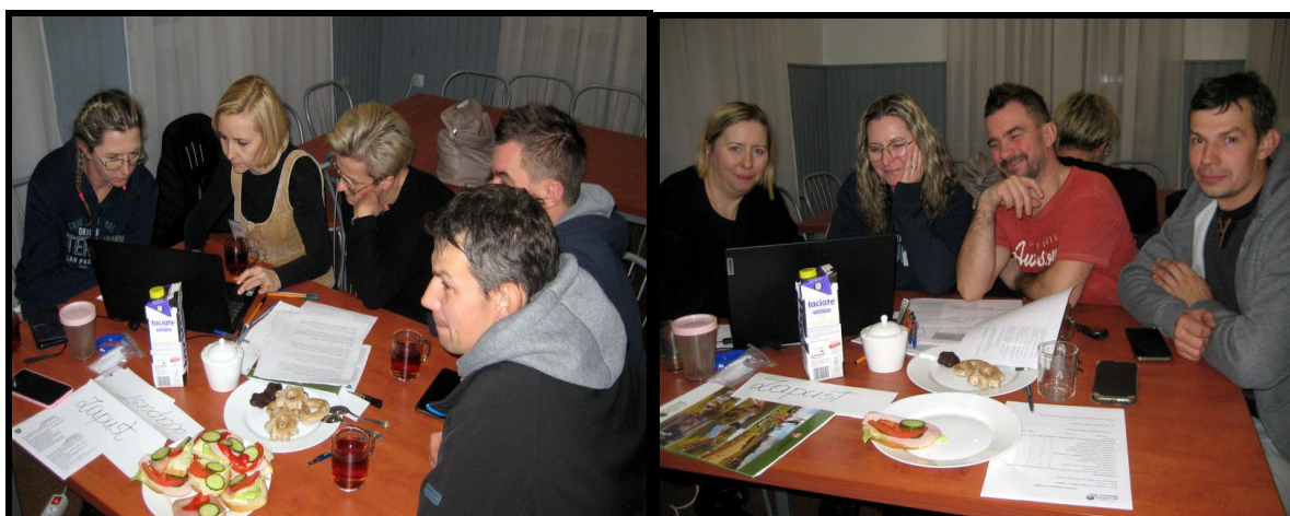
Grupa Odnowy Wsi w czasie warsztatów opracowania Sołeckiej Strategii Rozwoju Świetlica wiejska w Zapuście w dniach 04-05.12.2023 r.

SOLECKA STRATEGIA ROZWOJU –ZAPUST wypracowana przez GOW na warsztatach w ramach programu UMWW - „Wielkopolska Odnowa Wsi 2020+”