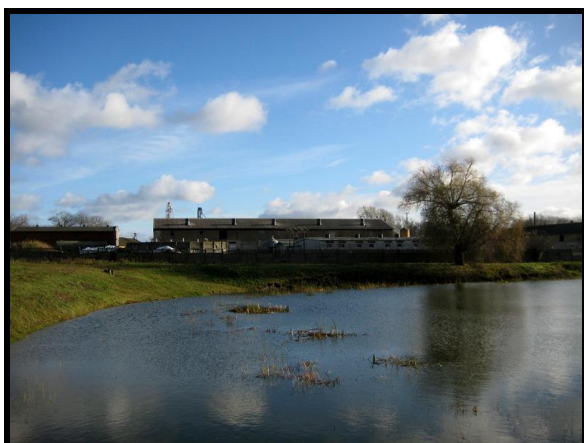
Prywatny staw i gospodarstwo rolne