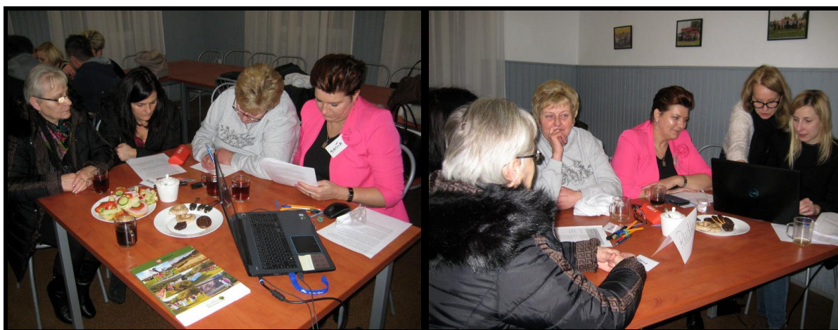
Grupa Odnowy Wsi w czasie warsztatów opracowania Sołeckiej Strategii Rozwoju Świetlica wiejska w Zapuście w dniach 04-05.12.2023 r.

SOŁECKA STRATEGIA ROZWOJU – RUDKI wypracowana przez GOW na warsztatach w ramach programu UMWW - „Wielkopolska Odnowa Wsi 2020+”