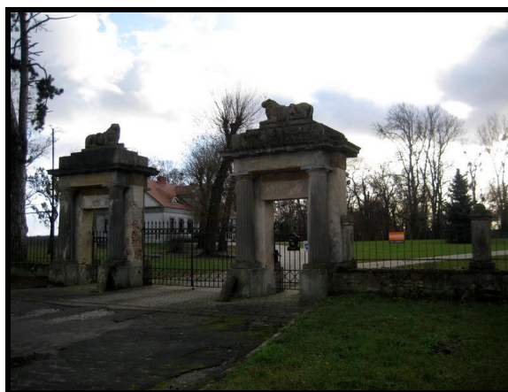
Pozostałości XIX Zespołu Dworskiego