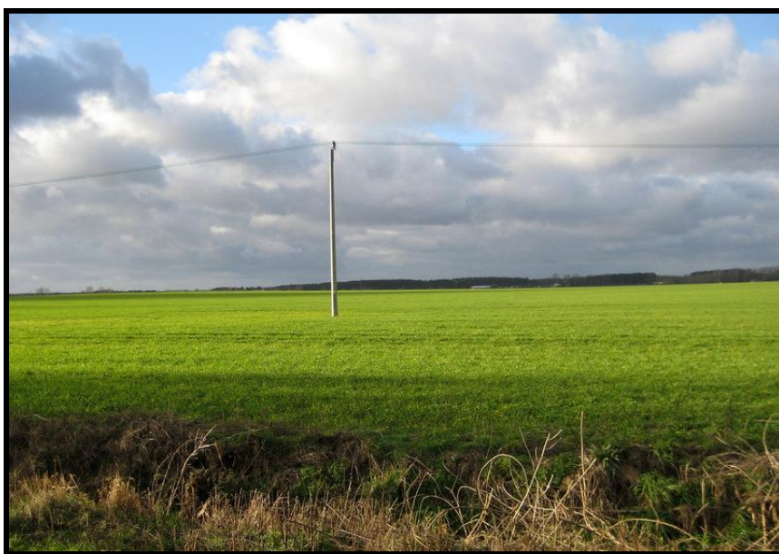
Walory przyrodnicze sołectwa

SOŁECKA STRATEGIA ROZWOJU – RUDKI wypracowana przez GOW na warsztatach w ramach programu UMWW - „Wielkopolska Odnowa Wsi 2020+”